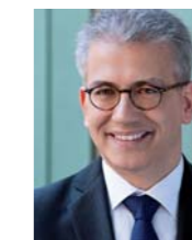
Ihr Tarek Al-Wazir

Auf den folgenden Seiten erhalten Sie genauere Informationen. Es würde mich freuen, wenn auch Ihr Unternehmen von dieser sinnvollen Kombination aus Theorie und Praxis profitieren kann.