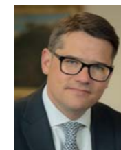
Ihr Boris Rhein

Absolventinnen und Absolventen dualer Studiengänge bringen mit ihrem Studien- und Ausbildungsprofil das Beste aus zwei Welten mit. Sie sind damit die idealen Wegbereiter und -begleiter, um derartige Prozesse zielgerichtet und ergebnisorientiert zu gestalten. Als Unternehmen finden Sie mit den hessischen Hochschulen und Berufsakademien kompetente Ansprechpartner, die Anregungen aus der Wirtschaft zur Einrichtung derartiger Studien- und Ausbildungsangebote offen gegenüber stehen. Nehmen Sie Kontakt auf!