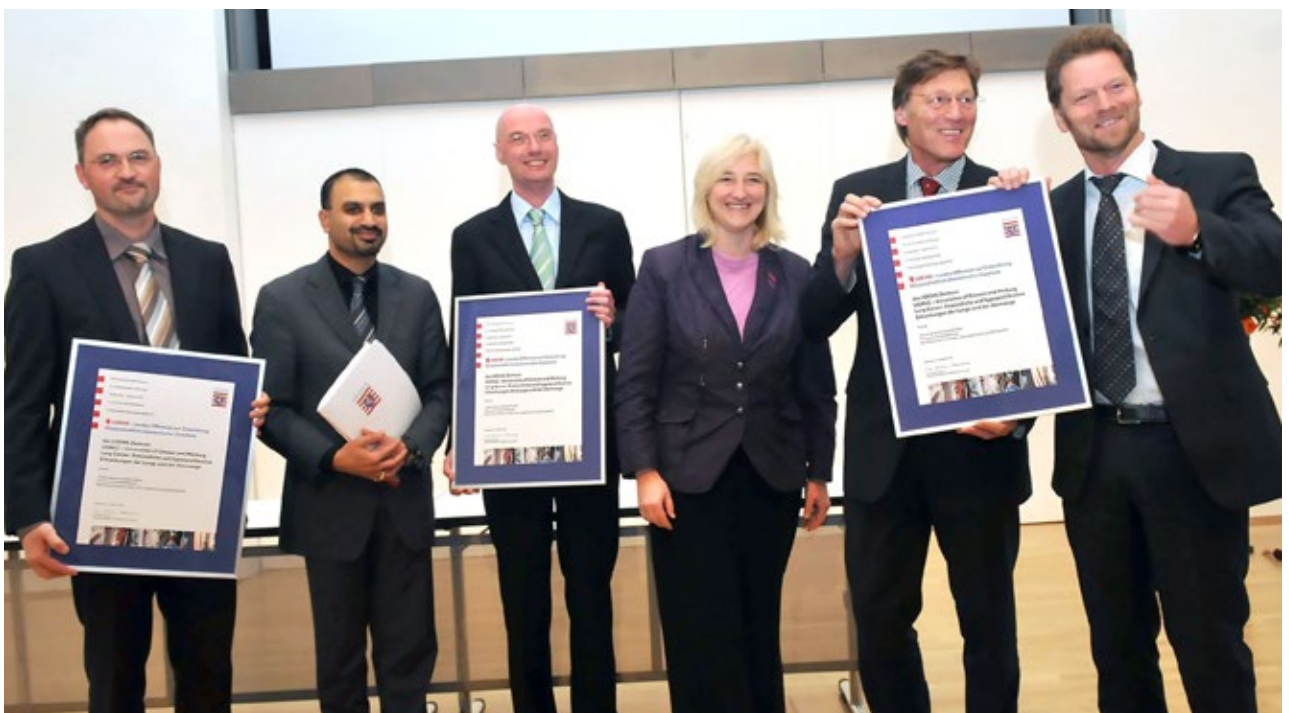
Bescheidübergabe im November 2009.