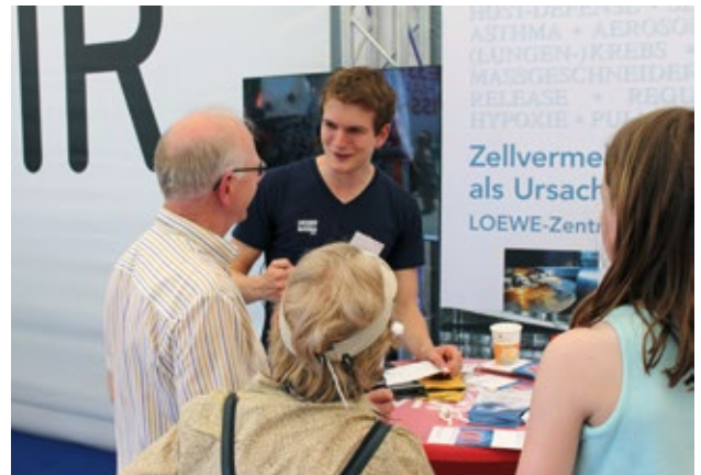
UGMLC beim Hessentag.