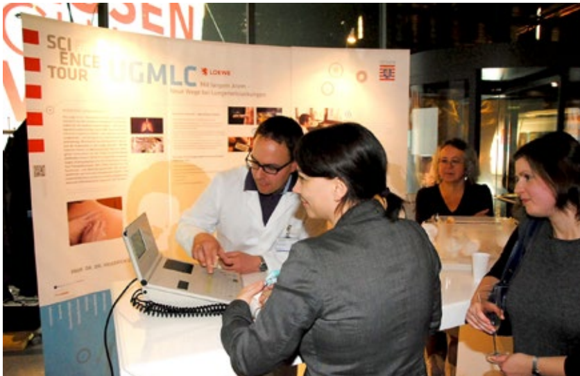
Science Tour, Station Gießen am 22.12.2012, Stand des UGMLC mit Lungenfunktionstest.